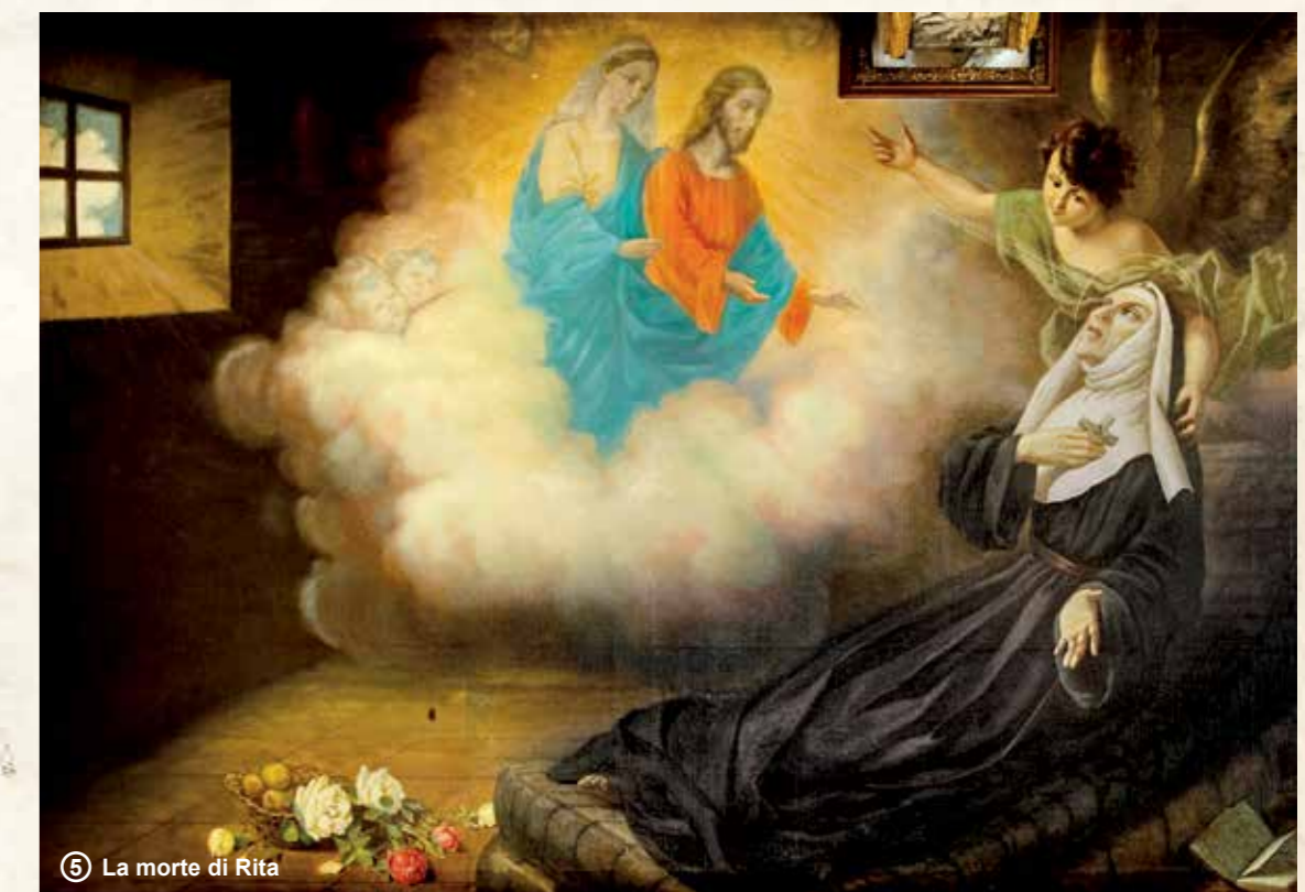
⑤ La morte di Rita

Alcuni luoghi, diventati mete ininterrotte di pellegrinaggio, ricordano la vita terrena di Rita svoltasi fra il piccolo borgo di Roccaporena, suo paese natale e Cascia, ove è vissuta per quaranta anni: a Roccaporena, la casa natale, la casa maritale, il lazzaretto, l'orto del miracolo, lo scoglio, la Chiesa di San Montano. A Cascia, il Monastero, il chiostro, la cella ed il Santuario a lei dedicato, ove in un'urna di cristallo riposano le sue spoglie mortali. La festa di Santa Rita è il 22 Maggio.