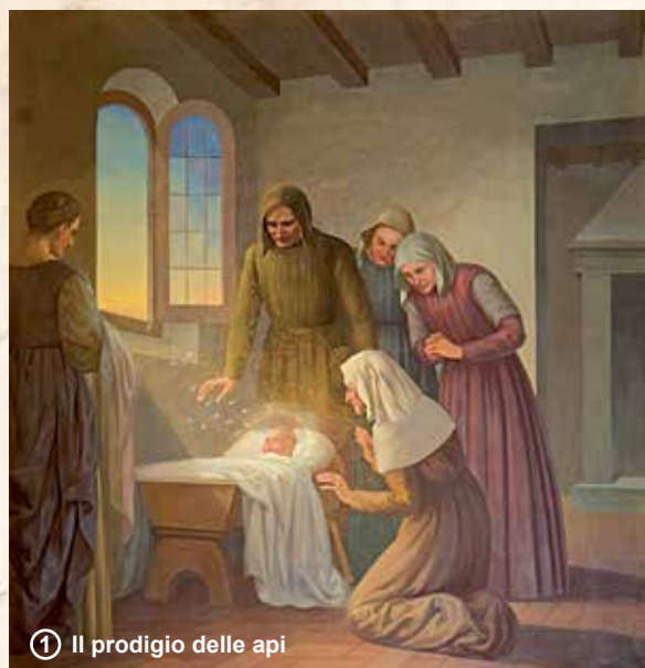
① Il prodigio delle api