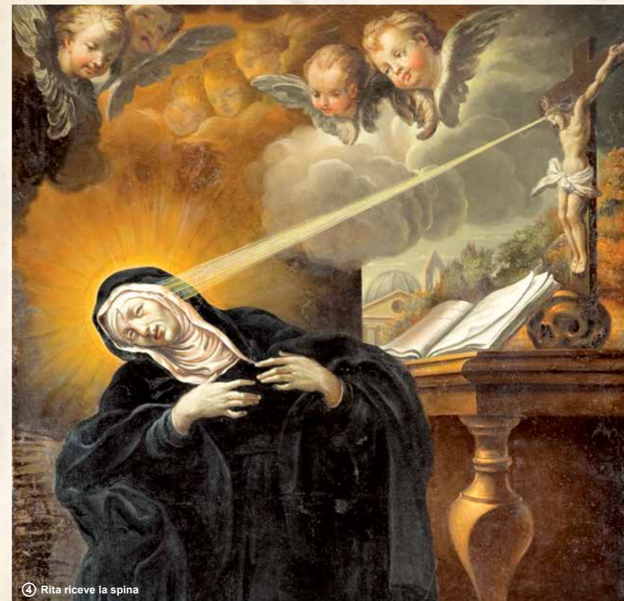
④ Rita riceve la spina

Una sola volta, nell'Anno Santo del 1450, la piaga si rimarginò per permetterle di