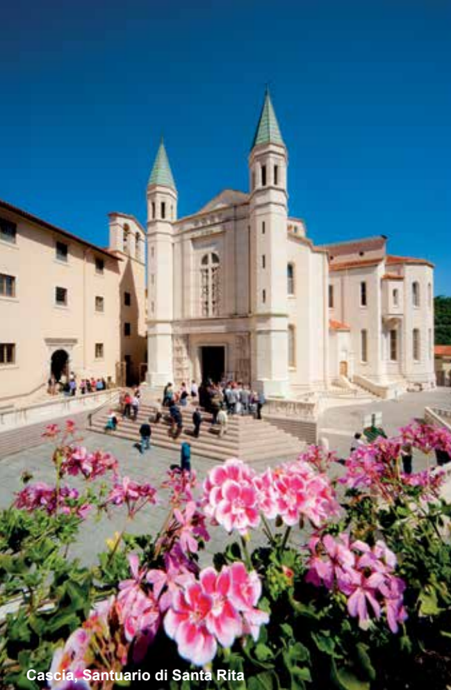
Cascia, Santuario di Santa Rita